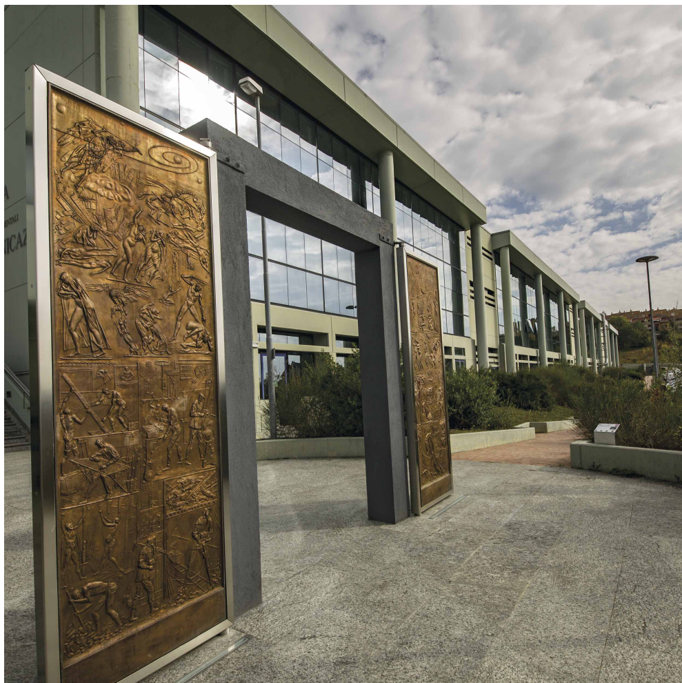
Rettorato - Porta del Tempio della vita dello scultore Venanzo Crocetti