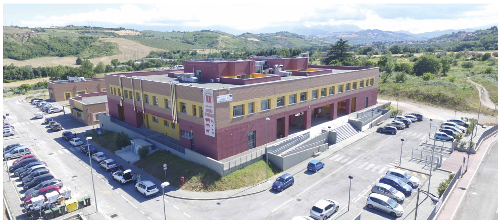
Il Campus Ruggero Bortolami