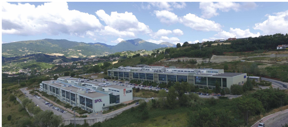
Il Campus Aurelio Saliceti