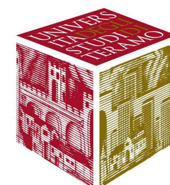
TAVOLA ROTONDA I RAPPORTI INTERSOGGETTIVI NELLA NUOVA LEGGE URBANISTICA REGIONALE: IL RUOLO DI REGIONE, PROVINCE E COMUNI